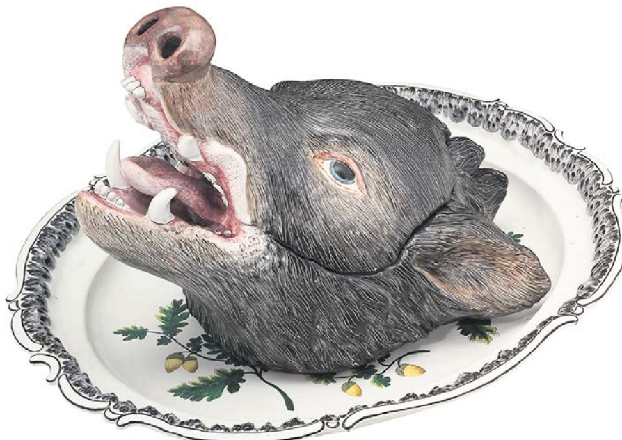
EBERKOPFTERRINE, CA. 1748/53.

Tigerfinken anziehen, sich in den Butterfly Chair fläzen und ein Colafröschi lutschen: Oft fällt's uns gar nicht mehr auf, aber in unserem Alltagsdesign wimmelt's von tierischen Figuren. Eine Ausstellung im Museum für Gestaltung in Zürich spürt dieser animalischen Energie in über 600 Designobjekten nach. FLO